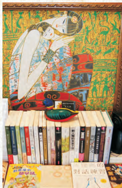
▲ 書店不定期舉辦親子講座等活動

在青少年閱讀，又更是另一個挑戰。在體制內的教育裡，往往追求成績卓越，很難讓孩子能夠在閒暇的時候耐心讀一本課外書，著實剝奪了享受閱讀的樂趣。但有趣的是，邱老師發現他的孩子，即使在國中繁重的課業裡，也從未在家裡看過他複習功課，但課外讀物仍一本一本地讀，可學習的成績卻也不差，一問之下原來熱愛讀書的孩子，總是自主管理學習課業，妥善安排時間，無論如何一定要好好看一本自己想看的書，而自小培養起來的耐心與理解能力，也讓他