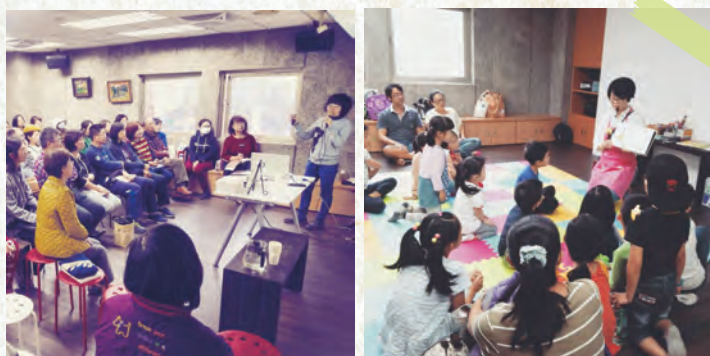
▲透過講座拉近人與書本的距離

每日，太陽時間 10 點開始的12個小時，無論晴朗或陰雨，準時鐵捲門開啟，推門進來，在熟悉與陌生距離之間，在工作與日常生