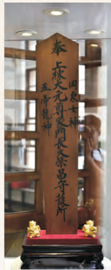
現保存於歷史建築頂街派出所內展示的棟札，是唯一記載頂街官吏派出所於1935年中部大地震後重建資訊的珍貴文物，圖為棟札正面，奉祀著日本神祇。

頂街派出所雖曾在戰後因使用需求，而改成警察機關最常見的紅色外牆，但在修復中，已根據研究調查資料恢復成原本的土黃色外牆後，保持該建物日治時期的模樣。2002年4月，因本建築外觀維持完整，依據文資法之規定，極具歷史保存價值的頂街派出所，正式公告登錄為歷史建築，逐步開啟她另一段人文歷史的文化生涯。