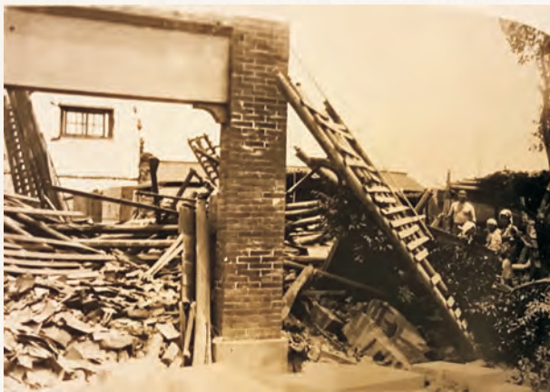
頂街地區震後損壞嚴重。

遷建後不到4年，1935年4月21日於臺灣中部發生了劇烈的地震，依《昭和十年臺中州震災誌》的記載，頂街警察官吏派出所達到「大破」的損害程度，雖沒有言明「大破」損害程度為何，但從《昭和十年臺中州震災誌》中，豐原地區的損壞狀況照中可以知道，這次的震災對頂街警察官吏派出所造成了不可回復的損害。