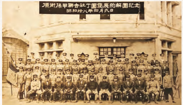
昭和十八年保甲聯合壯丁團紀念照已與現今的歷史建築頂街派出所所有著相同的外觀。